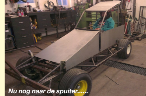
Nu nog naar de spijter.....

In huize Dokter werd een nieuwe Stockcar F1 gebouwd. Het resultaat mag er zeker wezen. Succes allemaal op Raceway Venray 23 maart.